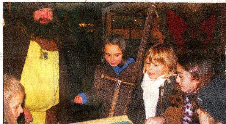
Der mittelalterliche Weihnachtsmarkt hat auch für die Kinder viele Aktionen zu bieten.